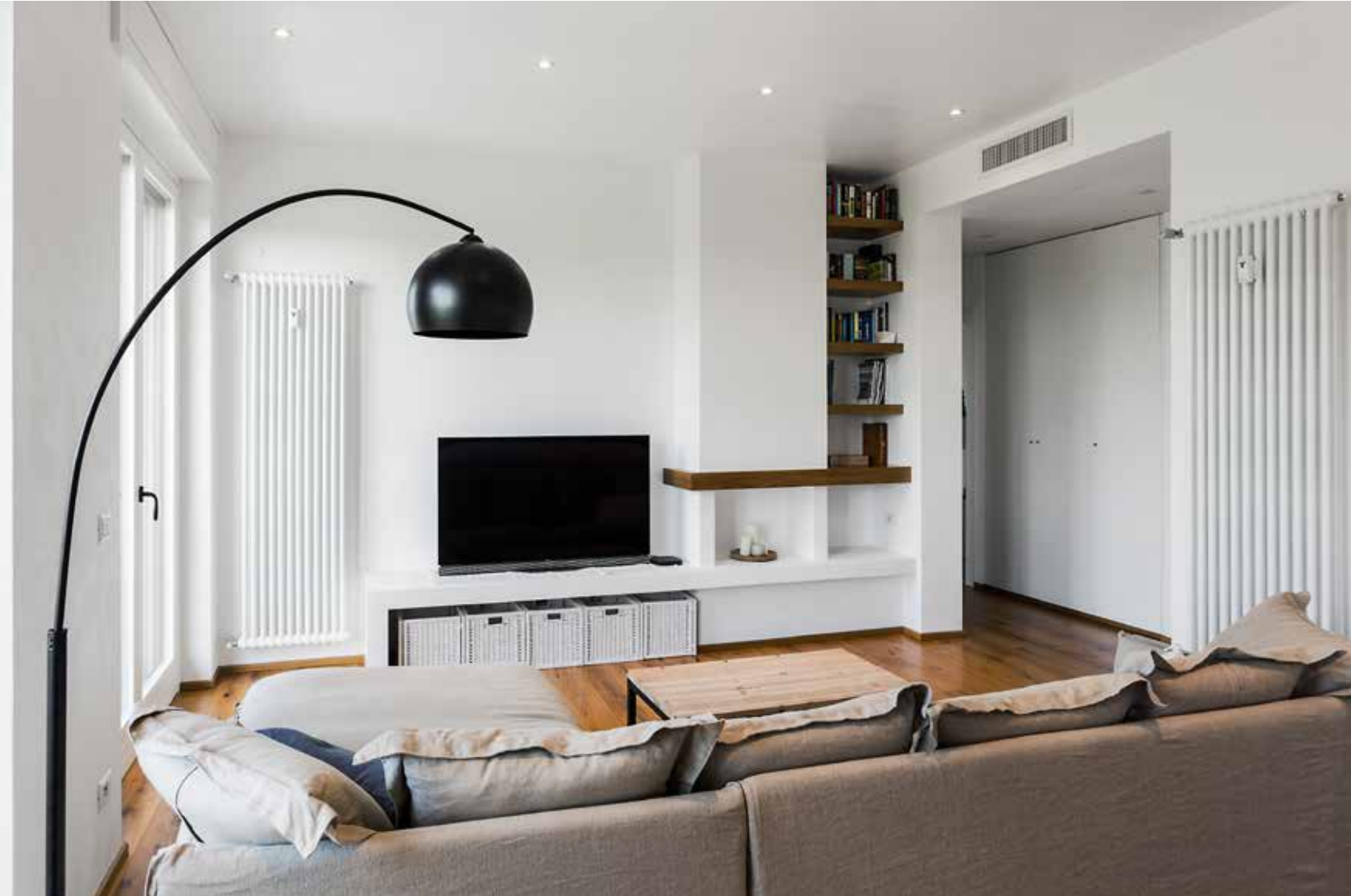
In the living area, contemporary style plays on the balance between clean and minimal lines and a lively and welcoming environment