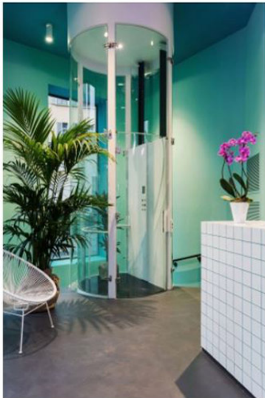
L'ascensore trasparente conduce al piano inferiore