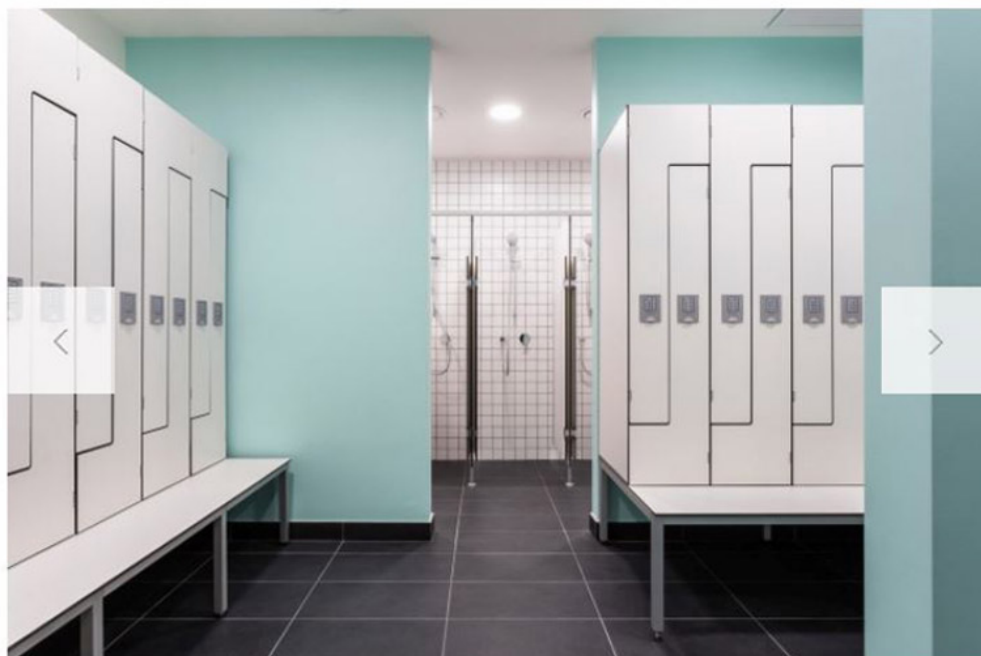
Pareti azzurro acqua e arredi essenziali negli spogliatoi femminili