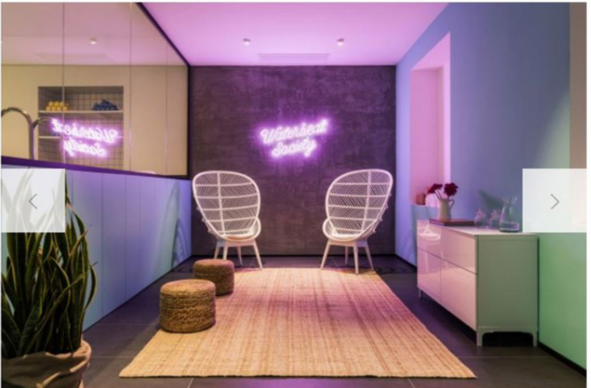
Dalla sala d'aspetto è visibile la piscina attraverso una grande vetrata