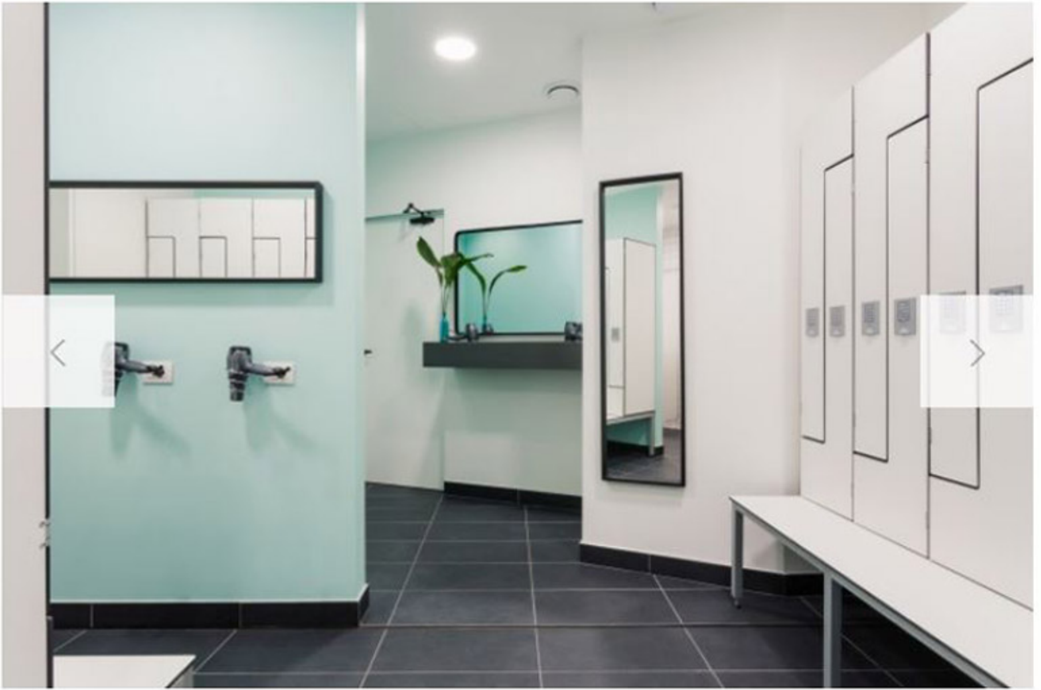
Decorati con specchi geometrici