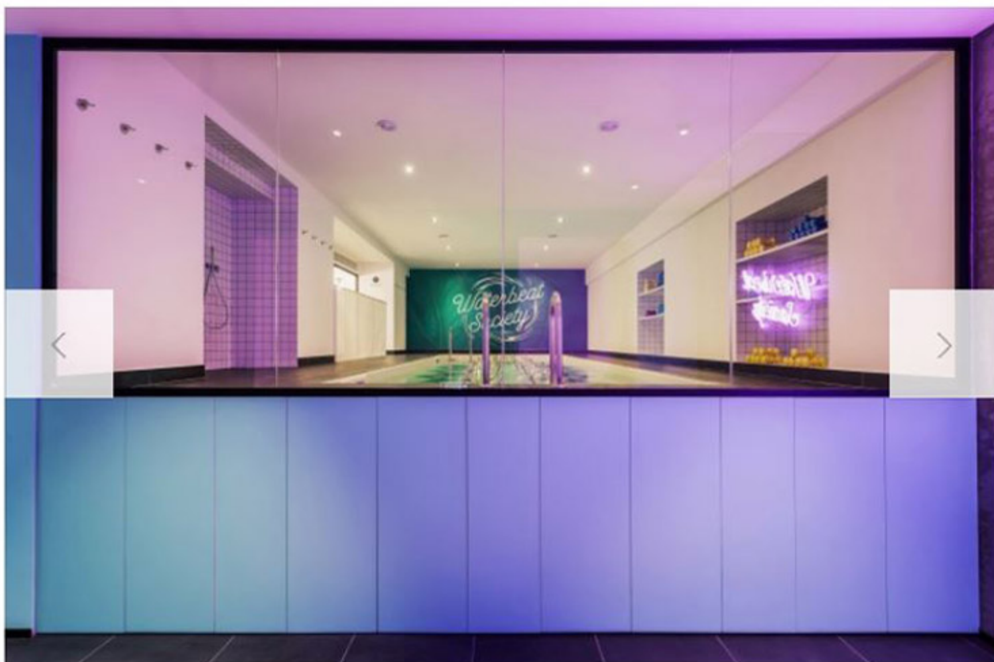
Waterbeat Society è la prima piscina milanese interamente dedicata all'hydrobike