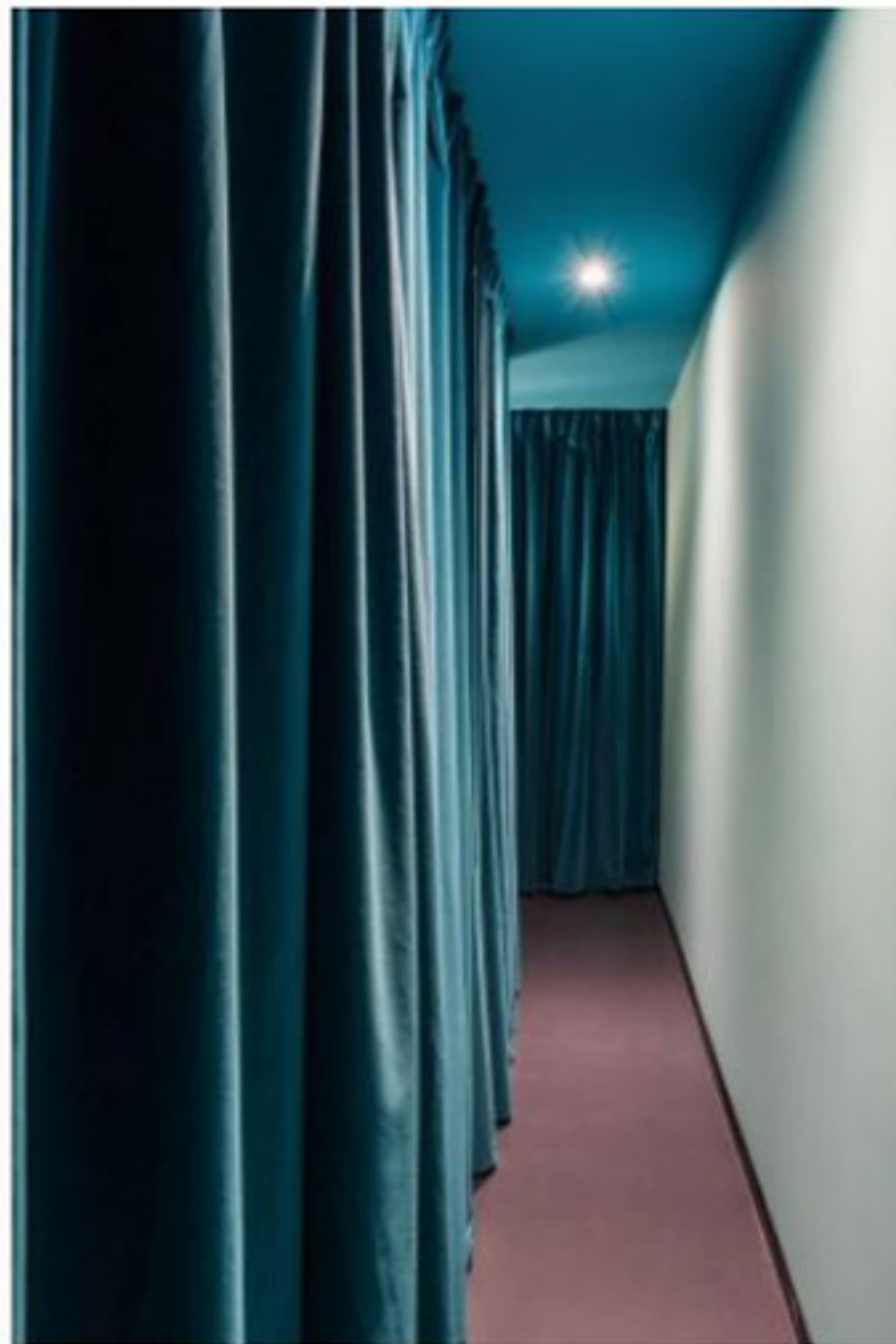
Corridoi e ambienti di raccordo sono caratterizzati da pesanti tende in velluto scuro