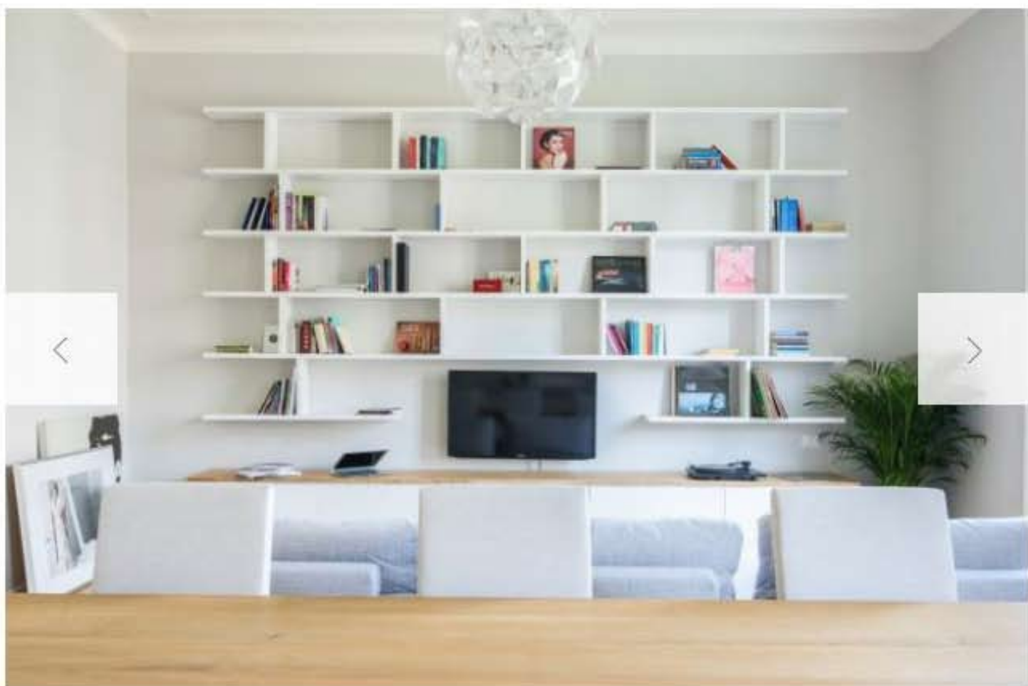
La libreria a parete, realizzata su misura, è disegnata con linee pulite, riprende il design essenziale dell'intero appartamento. La lampada a sospensione Hope di Luceplan impreziosisce lo spazio.