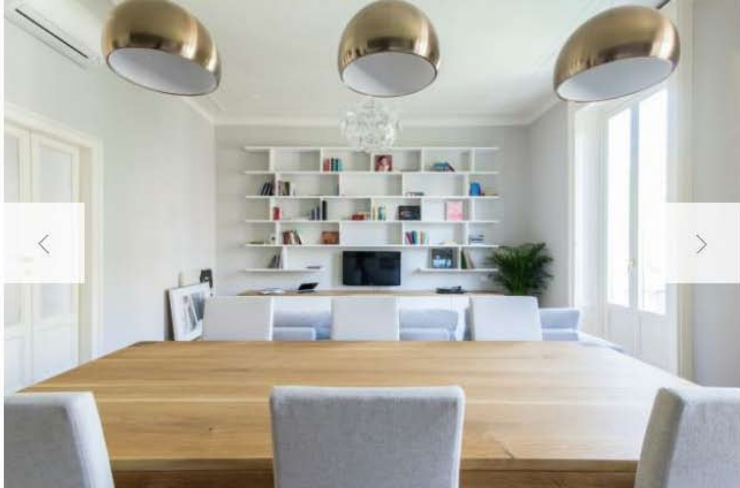
Sul tavolo da pranzo le Boule pendant di made.com