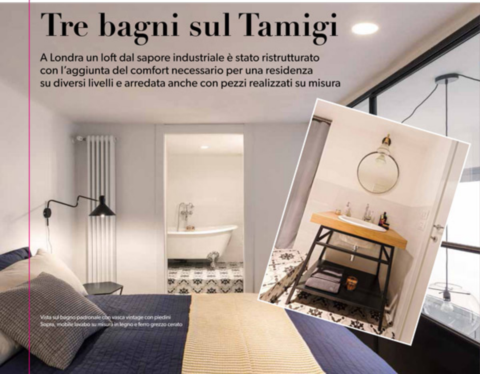
Vista sul bagno padronale con vasca vintage con piedini Sopra, mobile lavabo su misura in legno e ferro grezzo cerato

A Londra un loft dal sapore industriale è stato ristrutturato con l'aggiunta del comfort necessario per una residenza su diversi livelli e arredata anche con pezzi realizzati su misura