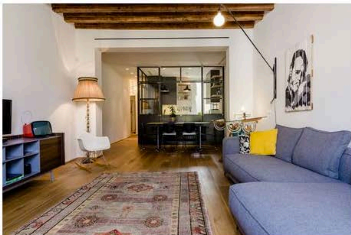
La cucina comunica con la zona pranzo attraverso una porta e una finestra (foto Nomade Architettura)

La ristrutturazione in un appartamento, progettato da Nomade Architettura , nel cuore della zona dei Navigli a Milano, uno dei più caratteristici e suggestivi della città. L'appartamento non era stato toccato da decenni e ha dovuto essere ridisegnato completamente.