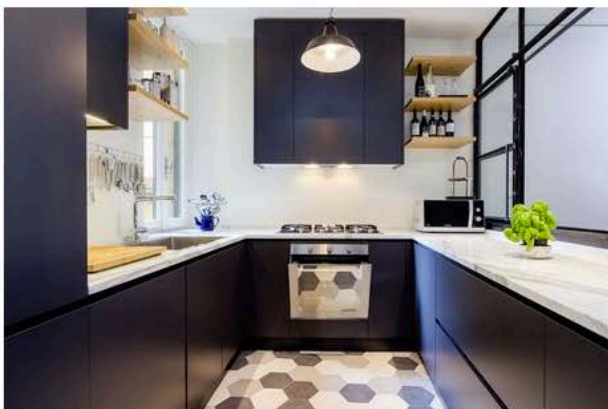
Uno scorcio della cucina (foto Nomade Architettura)

Fra queste la cucina, racchiusa in una scatola di ferro e vetro, comunicante con la zona pranzo attraverso una porta e una finestra all'interno della struttura che permettono di chiudere la cucina se necessario.