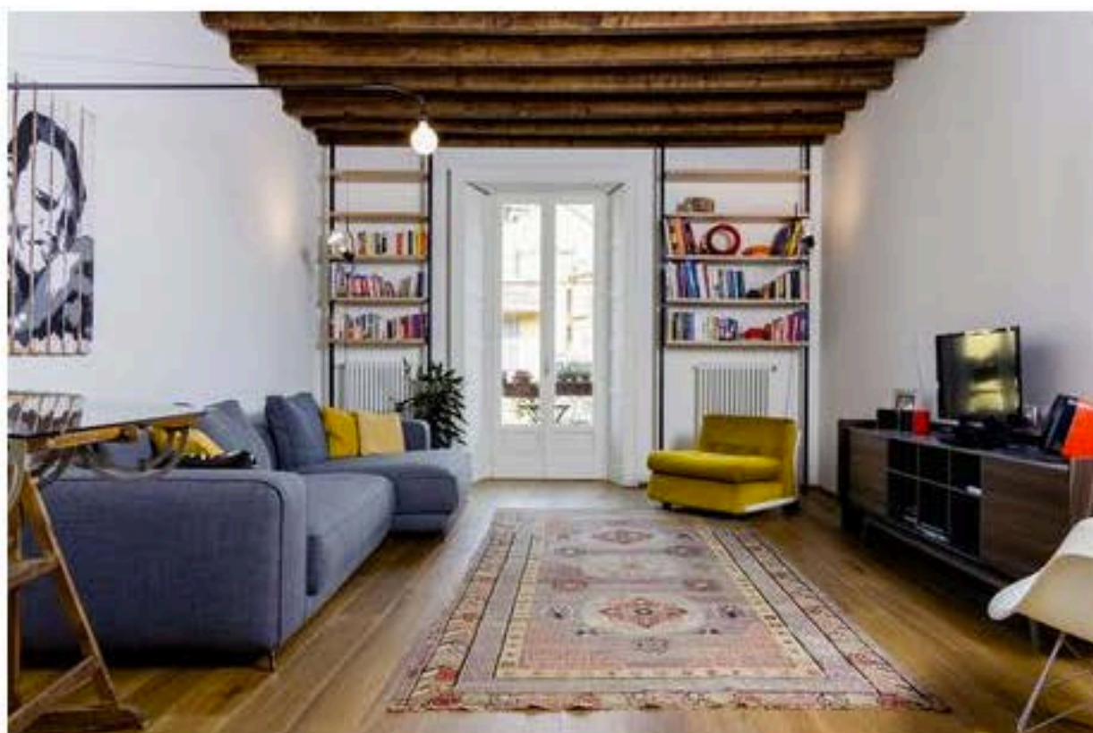
La zona salotto visto dalla cucina (foto Nomade Architettura)

La ristrutturazione in un appartamento, progettato da Nomade Architettura , nel cuore della zona dei Navigli a Milano, uno dei più caratteristici e suggestivi della città. L'appartamento non era stato toccato da decenni e ha dovuto essere ridisegnato completamente.