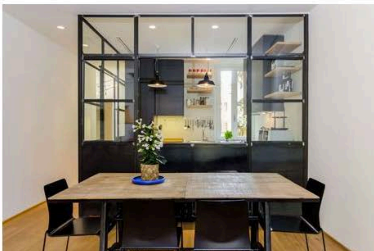
La cucina è racchiusa in una scatola di ferro e vetro

L'idea principale è stata quella di giocare con le peculiarità originali dell'appartamento, come le travi in legno del soffitto, coperte fino al giorno in cui il controsoffitto esistente è stato demolito, e gli infissi originali, in contrasto con un certo numero di scelte progettuali forti.