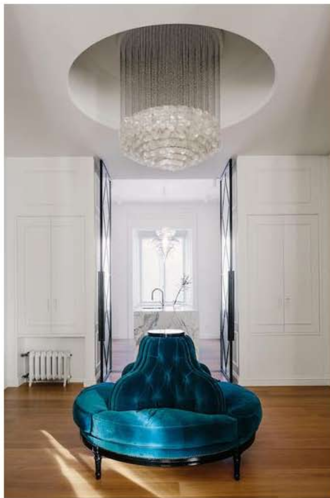
Nella foto: l'ingresso, con una seduta realizzata ad hoc fa e lo chandelier Panton Verpan.

A collegare soggiorno e cucina, due grandi porte vetrate che diventano pannelli decorativi quando aperti, o porte dall'elegante stile inglese quando chiuse.