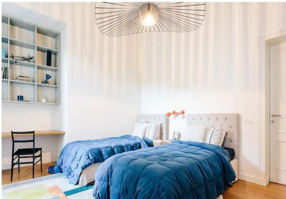
Nella foto: la camera dei ragazzi.

Grande importanza è stata data anche a un altro dei bagni presenti nella casa, che gioca con le forme geometriche. Qui, a decorare lo spazio, un disegno di marmo bianco e nero, attorno al quale ruotano timidamente tutti gli elementi presenti nel bagno, come la grande porta vetro che crea l'ambiente doccia, e delle piccole, vivacissime lampade a parete Ogilvy by Made.com, accanto alla specchiera.