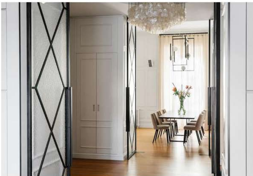
Nella foto: il corridoio con le grandi porte vetrate decorative che dividono gli spazi.

A collegare soggiorno e cucina, due grandi porte vetrate che diventano pannelli decorativi quando aperti, o porte dall'elegante stile inglese quando chiuse.