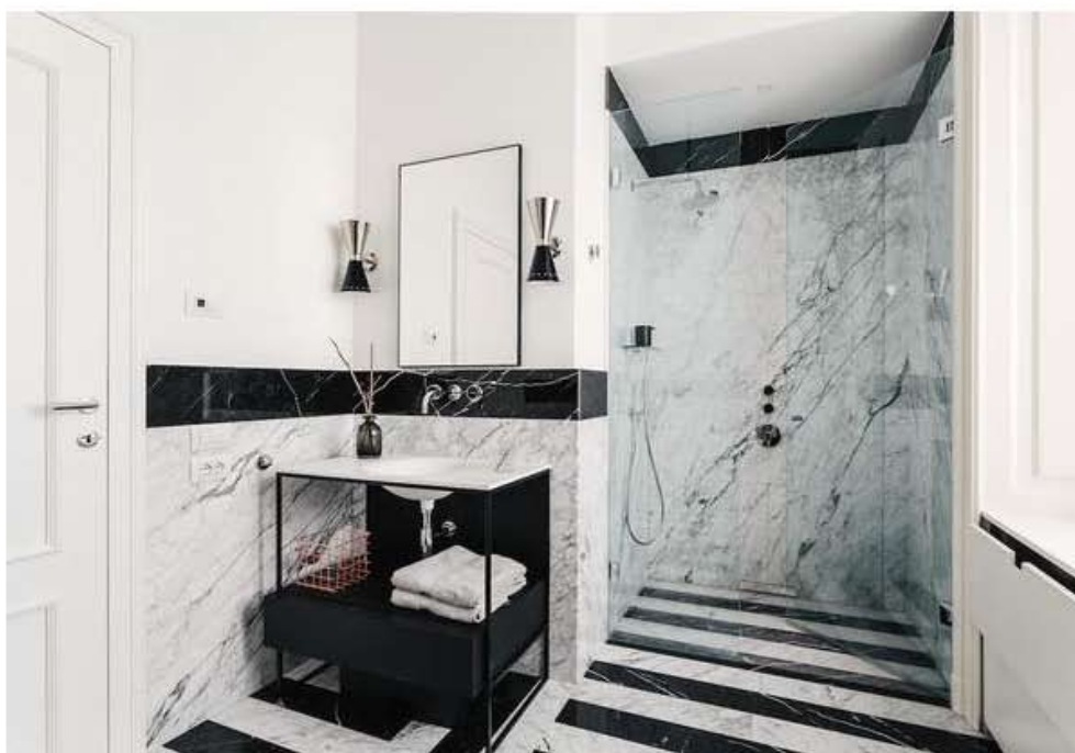
Nella foto: Uno dei bagni presenti nell'abitazione, caratterizzato dai forti contrasti di marmo bianco e nero.

Grande importanza è stata data anche a un altro dei bagni presenti nella casa, che gioca con le forme geometriche. Qui, a decorare lo spazio, un disegno di marmo bianco e nero, attorno al quale ruotano timidamente tutti gli elementi presenti nel bagno, come la grande porta vetro che crea l'ambiente doccia, e delle piccole, vivacissime lampade a parete Ogilvy by Made.com, accanto alla specchiera.